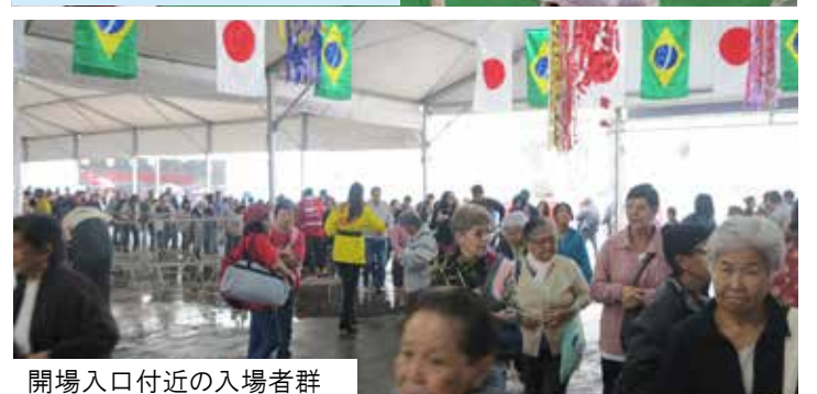
開場入口付近の入場者群