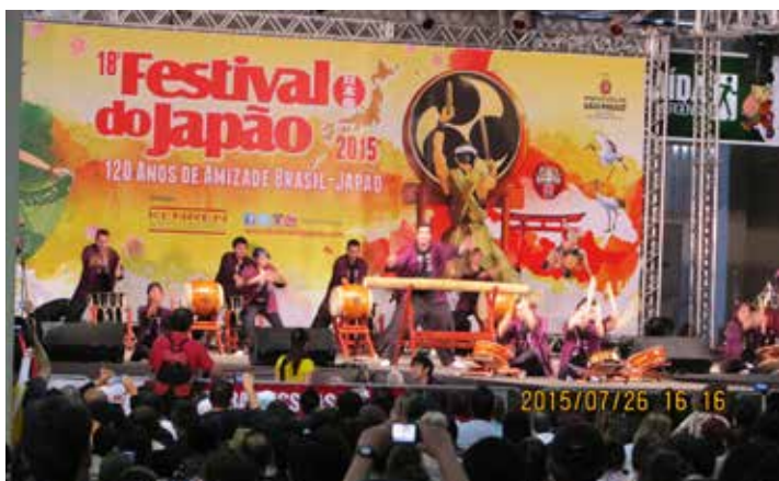
岩手県人会太鼓「雷神」も出演