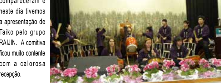
CONFRAERNIZAÇÃO COM A COMITIVA KENTYO A caminho do Paraguai, a comitiva do Kentyo passou por São Paulo apenas por um dia. Pela manhã a comitiva foi visitar o memorial do Imigrante no Parque Ibirapuera e a noite foi recepcionada com jantar oferecido pelo Kenjinkai do Brasil. Aproximadamente 90 associados compareceram e neste dia tivemos a apresentação de Taiko pelo grupo RAIJIN. A comitiva ficou muito contente com a calorosa recepção.