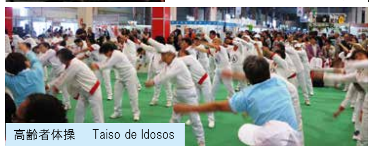
高齢者体操 Tai So de Idosos