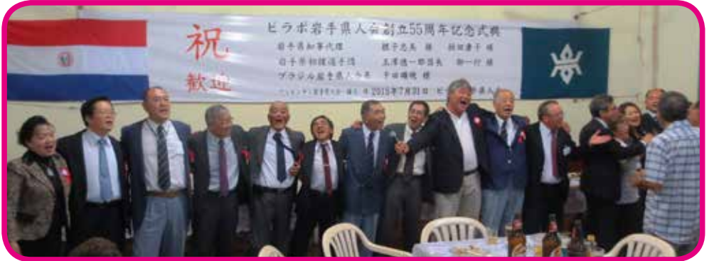
肩を組み北国の春を歌う皆さん

死に 必 頑 張 つ た 先 人 達 の 努 力 が 実 り、 原 始 林 は 広 大