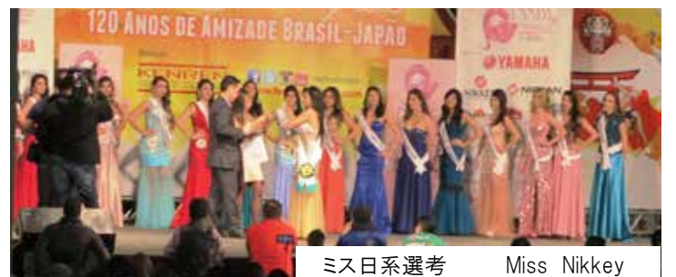
ミス日系選考 Miss Nikkey